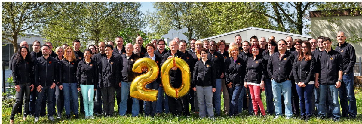
Kalsruher GBS-Team zum 20-jährigen Jubiläum 2014

Die Administration unserer Gesellschaft, darin enthalten Management, Finanzbuchhaltung sowie Marketing, beschäftigte ca. 21% (2013: 20%) der Mitarbeiter. Sowohl Management, Finance wie auch Marketing nehmen administrative Tätigkeiten für die Tochtergesellschaften wahr.